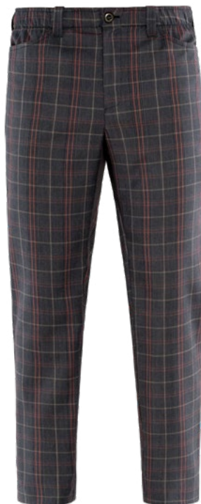
S119 Scozzese grigio

Grande classico Giblor's: pantalone unisex a vita alta, dall'ottima vestibilità, amato per il taglio asciutto della gamba.