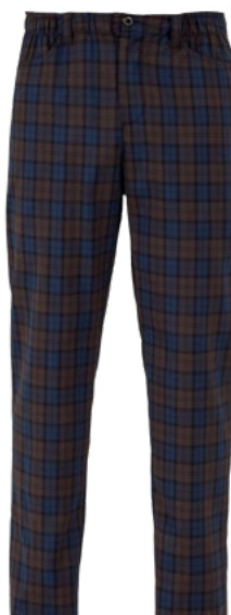
S322 Scozzese marrone