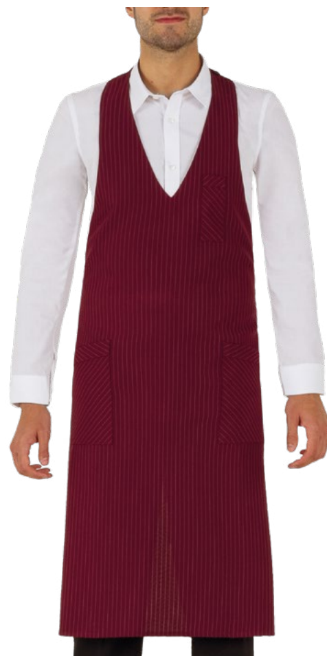
G35 Burgundy pinstriped