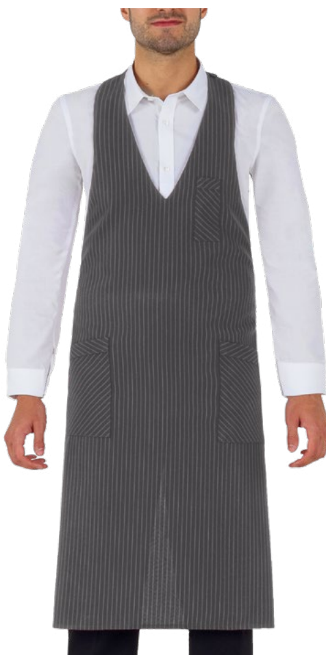
G12 Gessato grigio