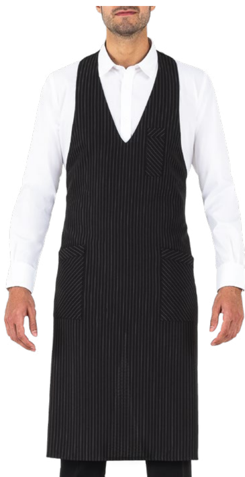
G32 Gessato nero