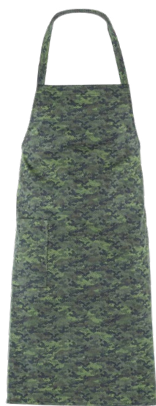
F019 Camouflage pixel