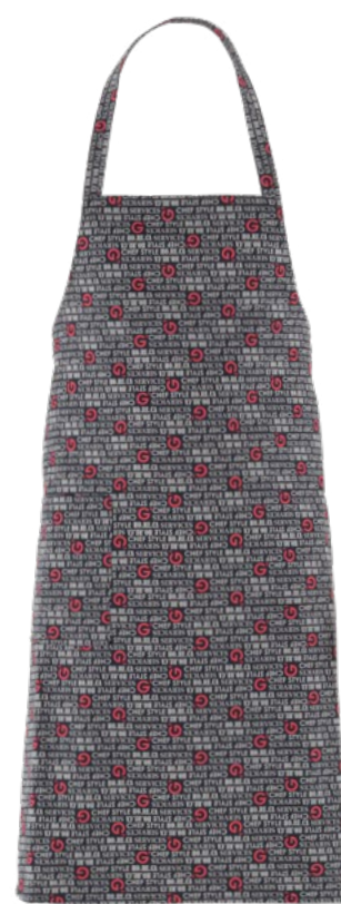
F020 G' horeca