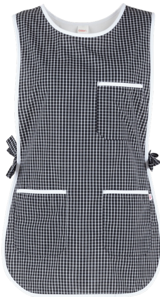
Q32 Quadro nero