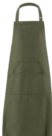
102 Verde militare